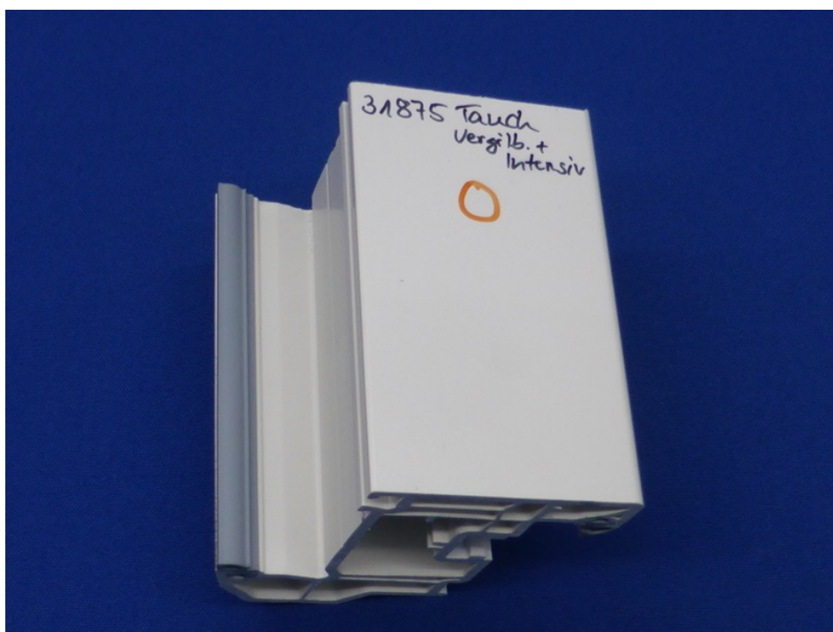
Abbildung 6 – Vergilbungsentferner + Intensivreiniger nach Tauchversuch