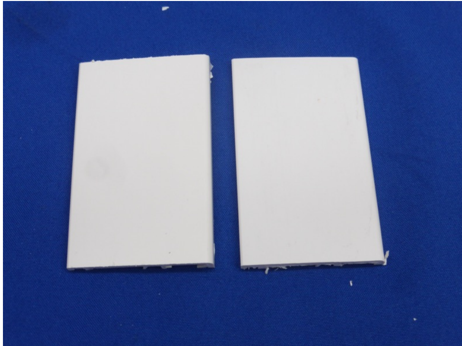
Abbildung 9 – Referenz (links) + S20UVA (rechts) nach der Schnellbewitterung