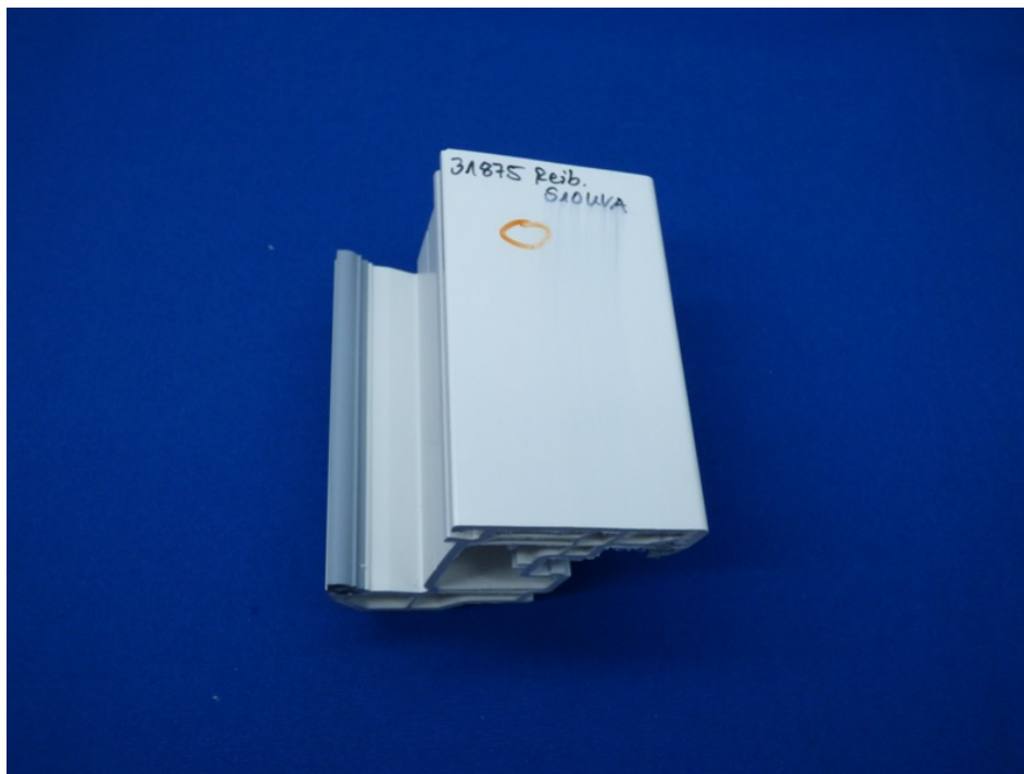
Abbildung 1 – S10UVA nach Reibversuch