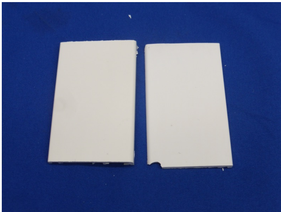
Abbildung 10 – Referenz (links) + Vergilbungsentferner + Intensivreiniger (rechts) nach der Schnellbewitterung