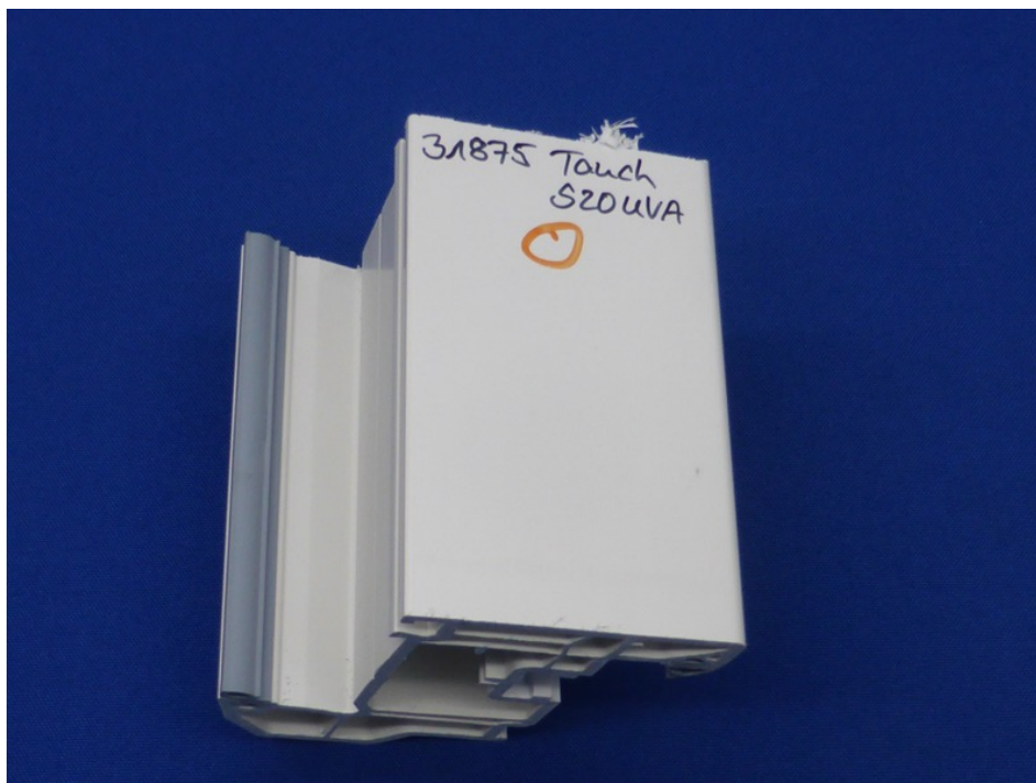
Abbildung 5 – S20UVA nach Tauchversuch