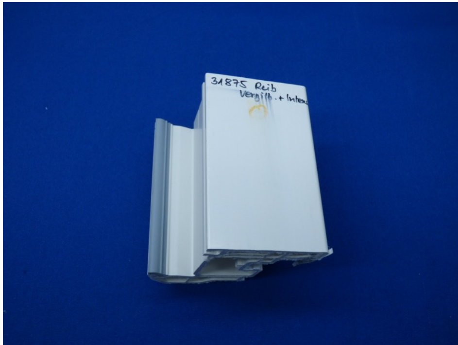
Abbildung 3 – Vergilbungsentferner + Intensivreiniger nach Reibversuch