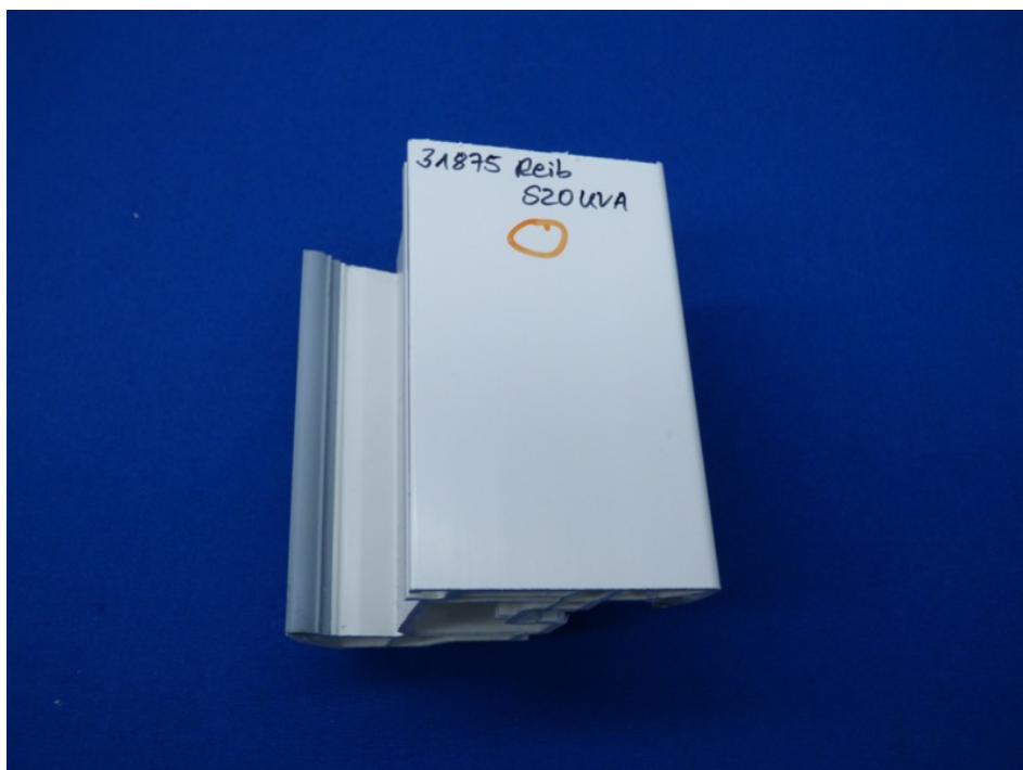
Abbildung 2 – S20UVA nach Reibversuch