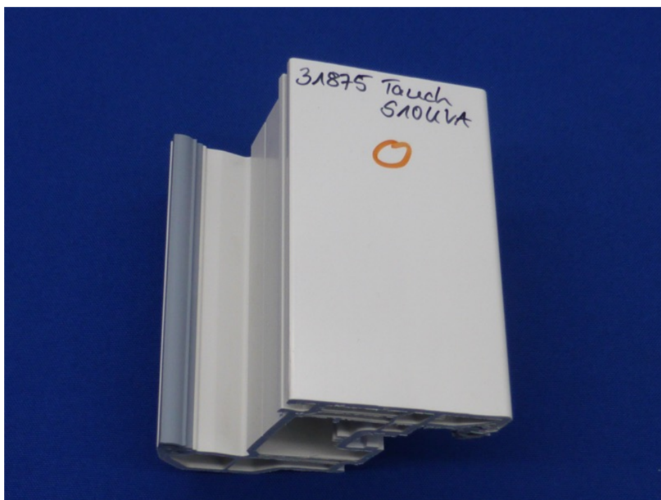
Abbildung 4 – S10UVA nach Tauchversuch